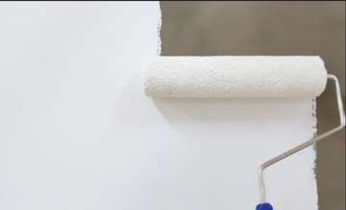
Cat Dasar Decor AS-310 1x lapis (by roll)