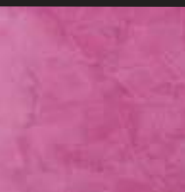
Middleton Color 031