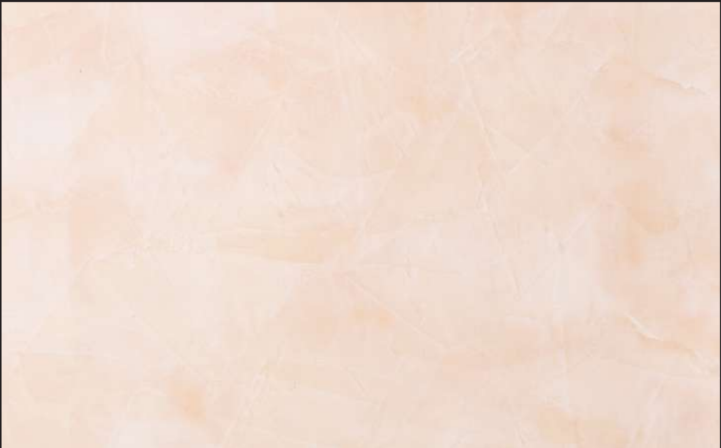
Pink Ground Color 020