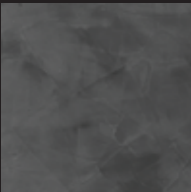
Pigeon Color 006