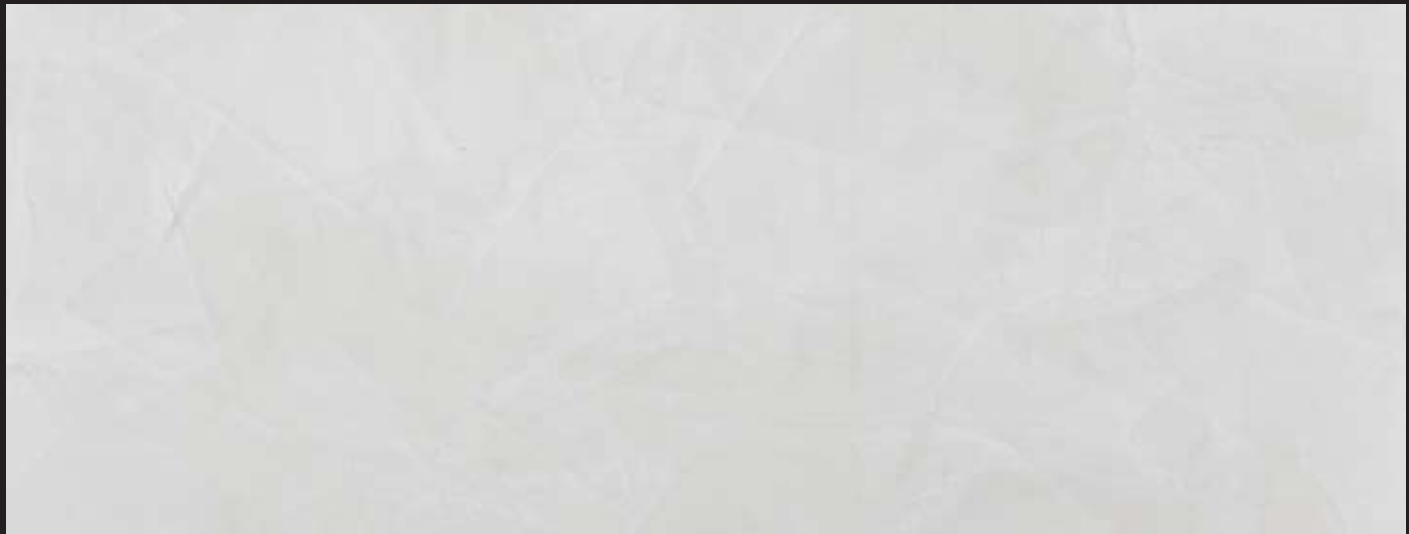
Tristan Grey Color 032 + Tristan White Color 001