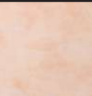
Radicchio Color 021