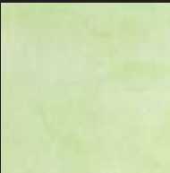
Saxon Green Color 024