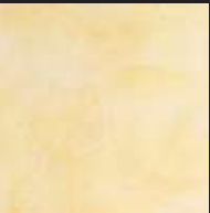
Citron Color 013