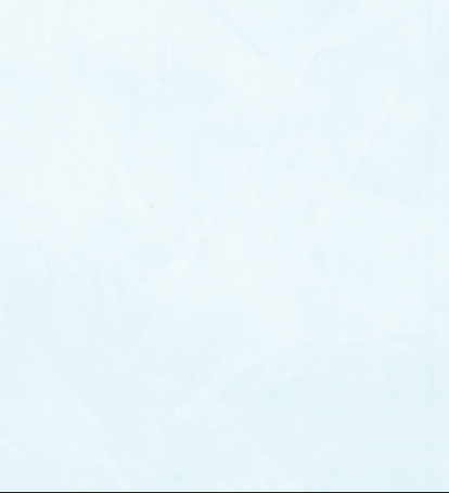
Pale Powder Color 007