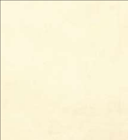
Lancaster Color 011