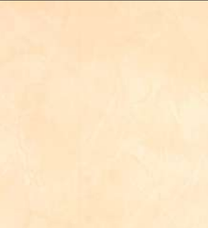
Tiar's White Color 019