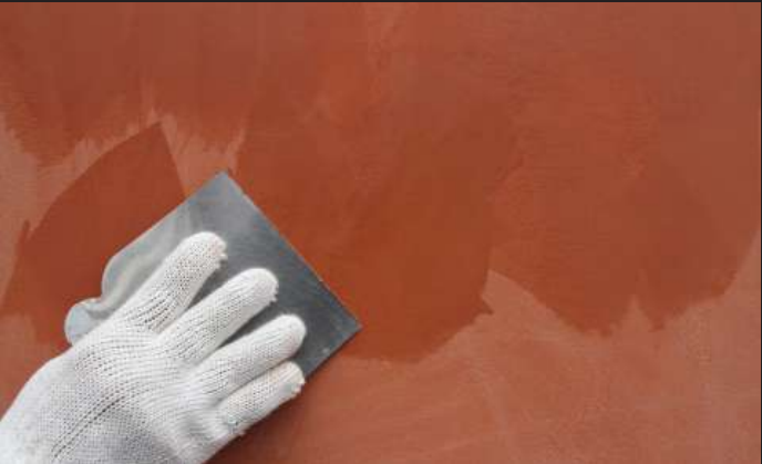
Membuat Motif Marmer Aplikasikan 2 - 3x lapis Leganza Stucco secara acak menggunakan kape stainless steel untuk menciptakan motif marmer.