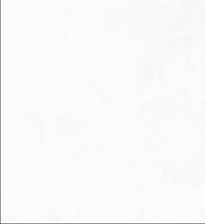
Pointing Color 003