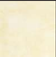
Dayroom Yellow Color 012