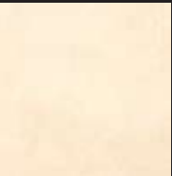
Farrow's Cream Color 016