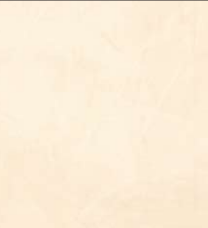
Tallow Color 015