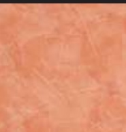
Charlotte's Locks Color 022