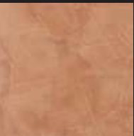
Red Earth Color 018