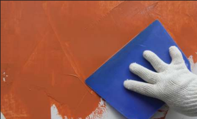
Cat Basecoat Aplikasikan 1-3x lapis Leganza Stucco ke seluruh bidang menggunakan kape plastik hingga rata dan menutup warna cat dasar.