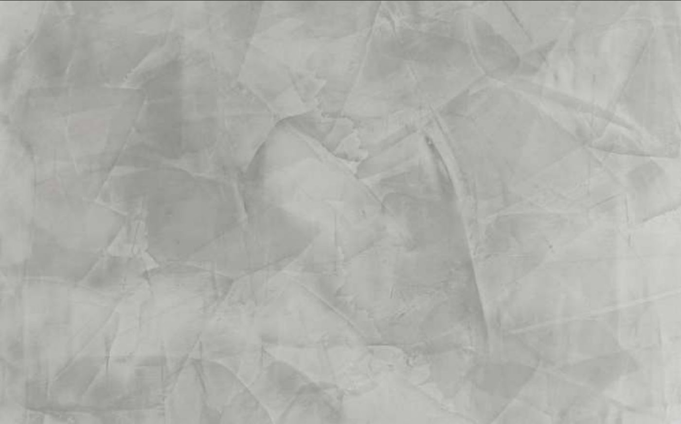
Manor House Grey Color 005