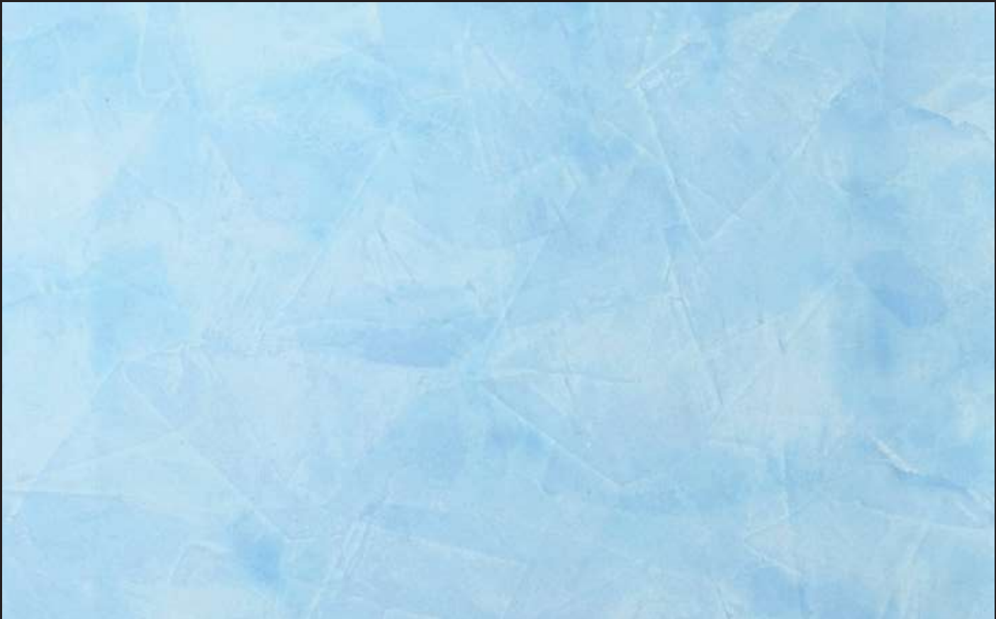
Borrowed Light Color 008