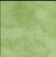
Folly Green Color 025