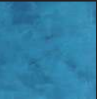
Cook's Blue Color 010