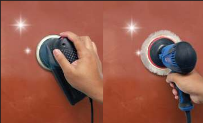
Membuat Efek Lebih Kilap Segera gosok menggunakan amplas orbital dengan kertas amplas no. 1000. Jika ingin lebih kilap, lanjutkan penggosokan menggunakan alat buffing tanpa wax atau rubbing compound. *Jika ingin tampilan matt/ dof, tidak perlu melakukan tahapan penggosokan menggunakan amplas /buffing.