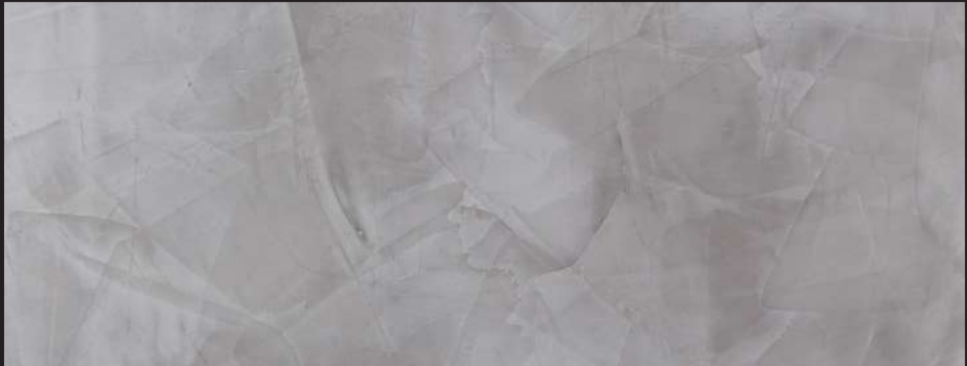
Lamp Room Grey Color 002