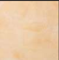
Dorset Cream Color 017