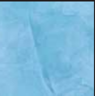
Lulworth Blue Color 009