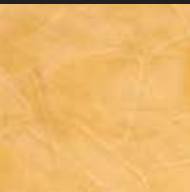
Babouche Color 014