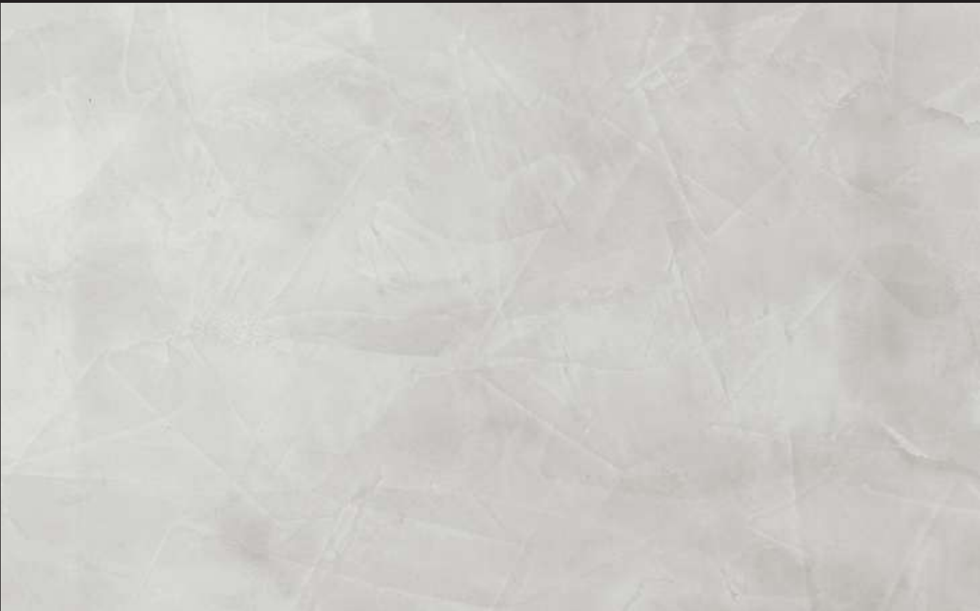
Pavilion Grey Color 004